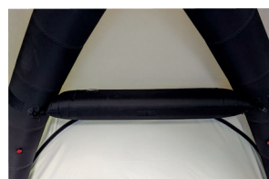
Tube de renfort latéral (pour le vent fort)