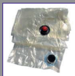
Chambre à air en TPU