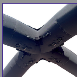
Monobloc souple 100% conçu pour éviter les matériaux rigides