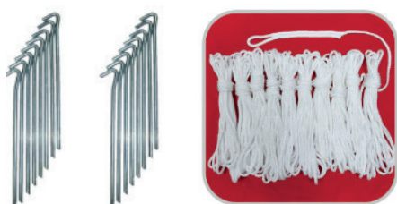
Haubanage X4 (cordes + piquets)