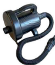
Pompe 220V (compatible pour tous le gonflable)