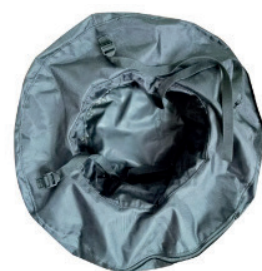
Sac de lestage à remplir avec du sable ou de l'eau