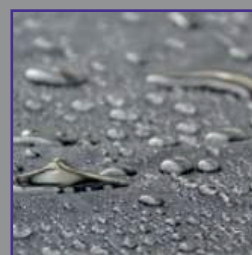
Toit en tissu polyester étanche et ignifugé B1 pour respecter les normes