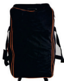
Sac de transport