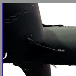
Système de gonflage/dégonflage one pump