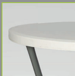
Plateau en PEHD 80cm