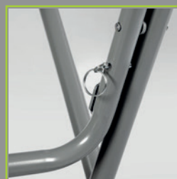
Blocage de la structure