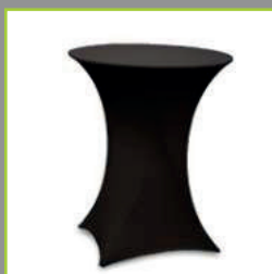
Haut de gamme avec sa housse lycra imprime ou de couleur