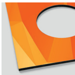
Fraisage de différentes formes