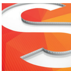
Découpe au format ou à la forme