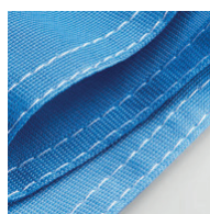
Double cotures sur les côtés