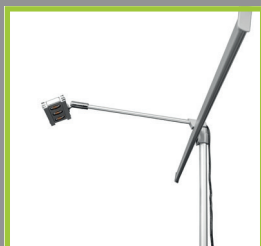
Option lampe LED