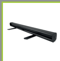
Zoom version noir