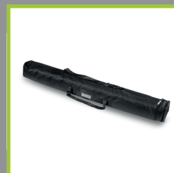
Sac de transport avec fenêtre pour carte de visite